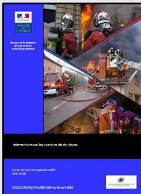
GDO Incendies de structures – 2018