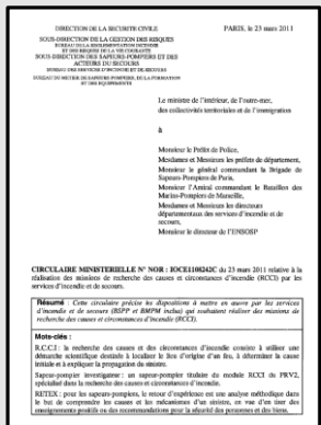
Circulaire ministérielle du 23/03/2011