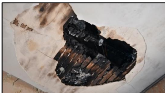
Plafond 2 ème étage logement voisin en apparence sain