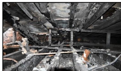
Faux-plafond en sous toiture arrière – 2 ème sinistre