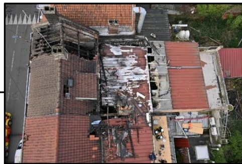
Vue depuis l'EPC – Post 2 ème sinistre