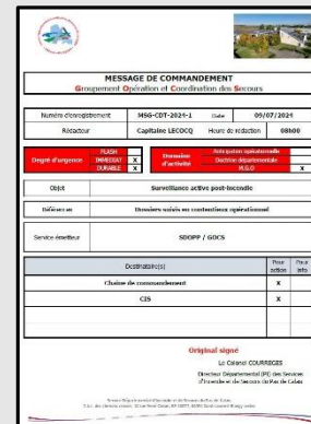
Message de commandement 2024-1 – Surveillance active post-incendie