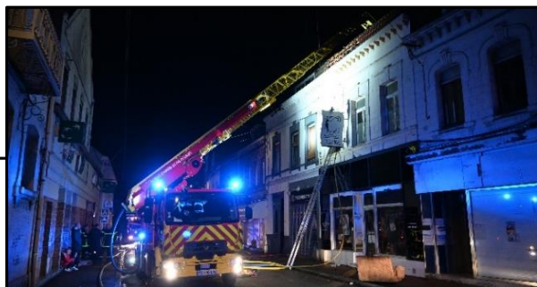
Façade A – 1 er incendie