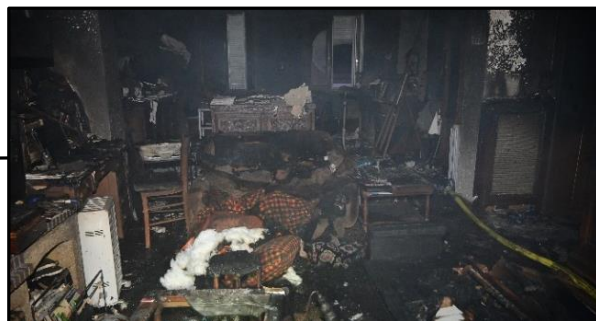
R+1 – 1 er incendie